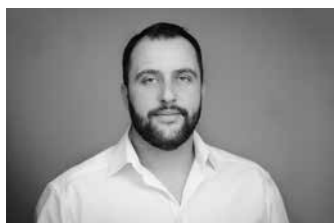
Mirnes Music Bauleitung